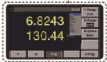
各種バッテリー抵抗測定