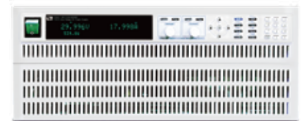
構成例：IT6522C+IT-E502 (5U) 出/入力仕様：±3kW/±240A/80V

注：電子負荷パワー拡張ユニットは単独運転不可で、必ずIT6500C電源と組み合わせ使用してください。 マスタースレーブ並列運転は最大90kW迄入力可能、9kW～60kW出力の場合に、AC入力は三相200V必要