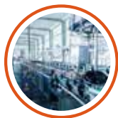
生産ライン検査等