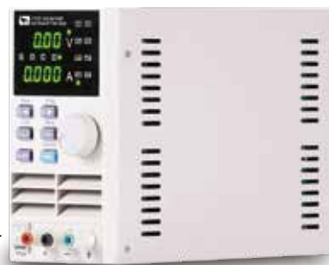
IT6720 : 60V/5A/100W