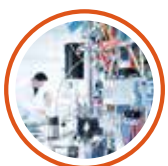
研究室、エージング