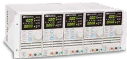
IT-E152 19" ラックキット5台収納